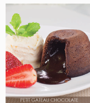
PETIT GATEAU CHOCOLATE

(cartucho com 6 unidades de 80g cada) QUANTIDADE DE CARTUCHOS CAIXA MASTER - 6 UNIDADES *PRODUTO CONGELADO TEMP. DE ARMAZENAMENTO - De -12°C a -18°C SHELF LIFE (VALIDADE) - 240 dias QUANT. CAIXAS MASTER POR PALLET - 340