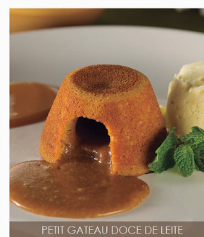
PETIT GATEAU DOCE DE LEITE