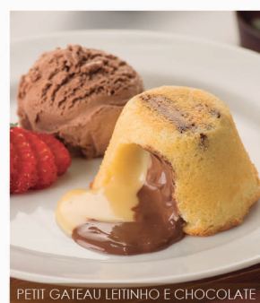
PETIT GATEAU LEITINHO E CHOCOLATE